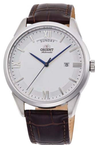
120 RN-AX0008S ¥34,100 (¥31,000+税)

[ 117～120 共通仕様 ] 自動巻き(手巻き付) / 駆動時間: 40 時間以上(最大巻き上げ時) / 秒針停止装置付 / 22 石/無機ガラス/シースルーバック/耐磁 1 種 日常生活用強化防水 (10 気圧) / ケース: ステンレススチール/バンド: ステンレススチール (SUS316L) (117～119)・皮革 (120) / ブッシュ観音式中留 ケース・バンドカラー: ピンクゴールド色めっき (117 ※8 )・ゴールド色めっき (118・119 ※8 ) / ケースサイズ: H47.0 × W40.8 × T11.9 mm / バンド幅: 20mm 精度: 日差+25 秒～-15 秒 (Made in Japan)