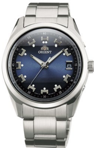
115 WV0071SE ¥39,600 (¥36,000+税)