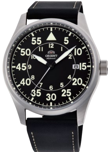
27 RN-AC0H03B ¥29,700 (¥27,000+税)

[ 24・25 共通仕様 ] 自動巻き (手巻き付) / 駆動時間: 40 時間以上 (最大巻き上げ時) / 秒針停止装置付 / 22 石 / 無機ガラス / ルミノスライト / 耐磁 1 種 日常生活用強化防水 (10 気圧) / ケース: ステンレススチール / ケースカラー: 黒色めっき (24) / バンド: ナイロン