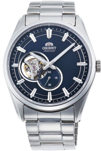
80 RN-AR0002L ¥46,200 (¥42,000+税)