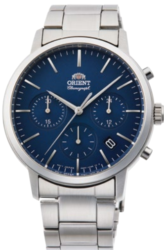
88 RN-KV0301L ¥24,200 (¥22,000+税)