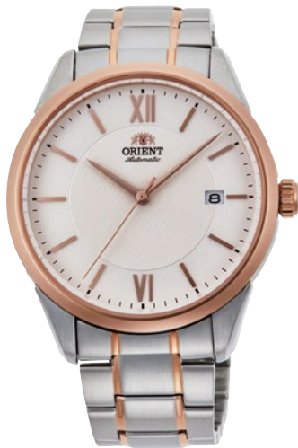
117 RN-AC0012S ¥38,500 (¥35,000+税)