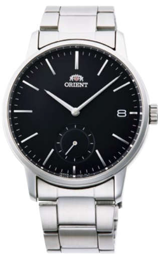
98 RN-SP0001B ¥20,900 (¥19,000+税)