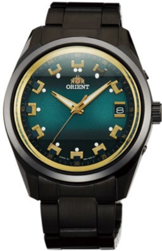
113 WV0051SE ¥42,900 (¥39,000+税)