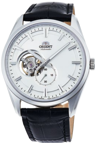
81 RN-AR0003S ¥44,000 (¥40,000+税)