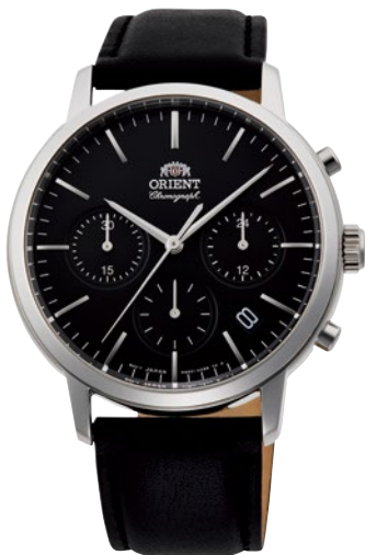
97 RN-KV0303B ¥22,000 (¥20,000+税)