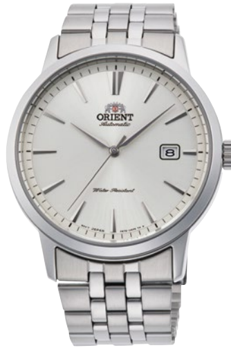
122 RN-AC0F02S ¥28,600 (¥26,000+税)