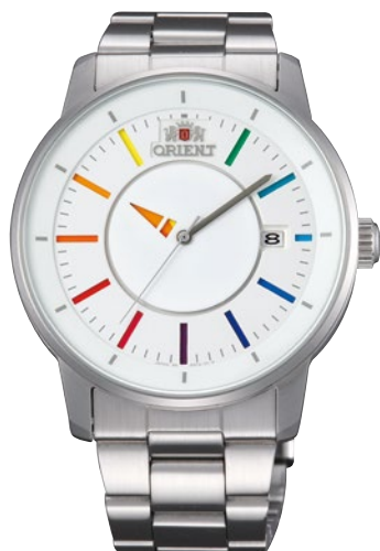
125 WV0821ER ¥25,300 (¥23,000+税)