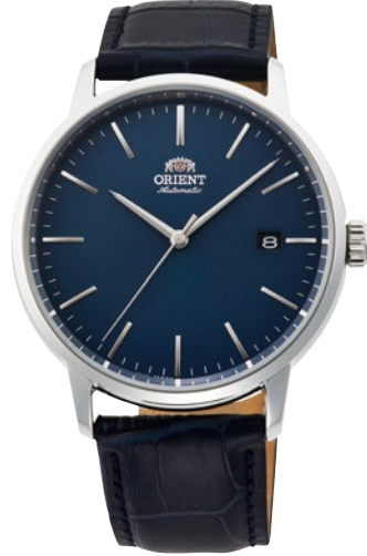
87 RN-AC0E04L ¥28,600 (¥26,000+税)