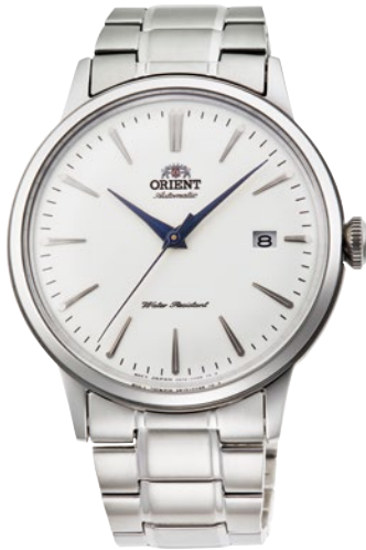
64 RN-AC0001S ¥35,200 (¥32,000+税)