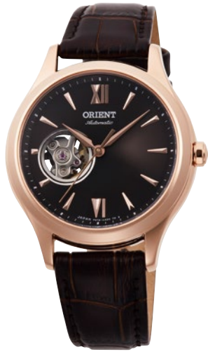
69 RN-AG0727Y ¥34,100 (¥31,000+税)