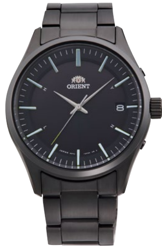
112 RN-SE0004B ¥42,900 (¥39,000+税)