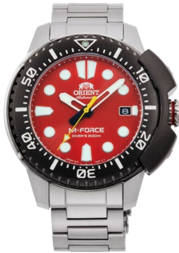
04 RN-AC0L02R ¥71,500 (¥65,000+税)