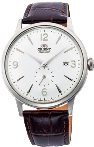
66 RN-AP0002S ¥35,200 (¥32,000+税)