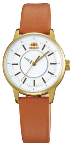
128 WV0051NB ¥25,300 (¥23,000+税)

[ 125・126 共通仕様 ] 自動巻き/駆動時間: 40 時間以上 (最大巻き上げ時) / 21 石/無機ガラス/シースルーバック/耐磁 1 種 日常生活用強化防水 (5 気圧) / ケース・バンド: ステンレススチール/プッシュ三つ折式中留/ケースサイズ: H47.4 × W41.4 × T11.3 mm/バンド幅: 22mm 精度: 日差+25 秒〜-15 秒 (Made in Japan) [ 127・128 共通仕様 ] 自動巻き (手巻き付) / 駆動時間: 40 時間以上 (最大巻き上げ時) / 21 石/無機ガラス/シースルーバック/耐磁 1 種 日常生活用強化防水 (5 気圧) / ケース: ステンレススチール/バンド: ステンレススチール (127)・皮革 (128) / プッシュ三つ折式中留 (127) ケースカラー: ゴールド色めっき (128) / ケースサイズ: H35.0 × W29.0 × T11.3 mm/バンド幅: 14mm/精度: 日差+40 秒〜-30 秒 (Made in Japan)