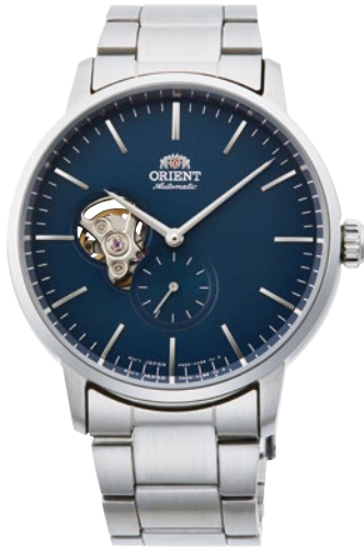
86 RN-AR0101L ¥39,600 (¥36,000+税)