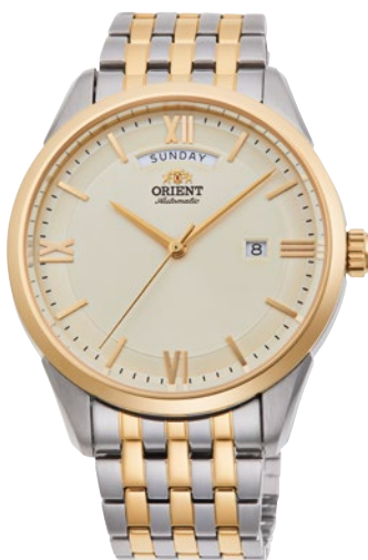
119 RN-AX0002S ¥42,900 (¥39,000+税)