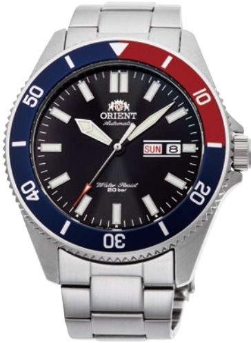
10 RN-AA0912B ¥37,400 (¥34,000+税)