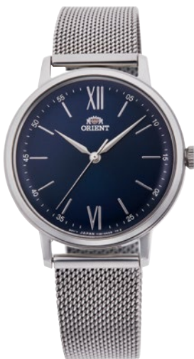
71 RN-QC1701L ¥20,900 (¥19,000+税)