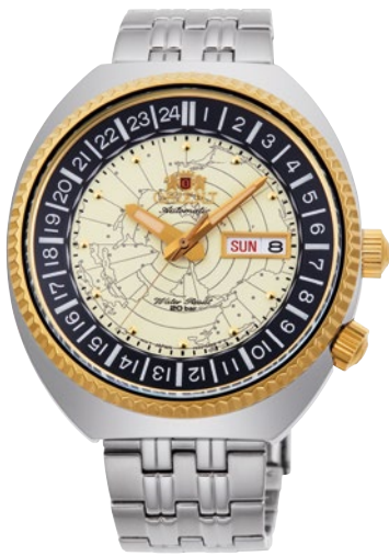
45 RN-AA0E01S ¥52,800 (¥48,000+税)