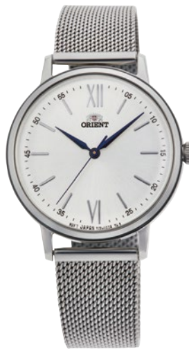
72 RN-QC1702S ¥20,900 (¥19,000+税)