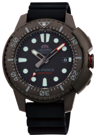
05 RN-AC0L03B ¥71,500 (¥65,000+税)