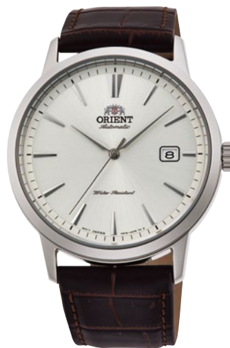
124 RN-AC0F07S ¥27,500 (¥25,000+税)

[ 121 ~ 124 共通仕様 ] 自動巻き(手巻き付) / 駆動時間: 40 時間以上(最大巻き上げ時) / 秒針停止装置付 / 22 石 / 無機ガラス / シースルーバック / 耐磁 1 種 日常生活用強化防水 (5 気圧) / ケース: ステンレススチール / バンド: ステンレススチール (SUS316L) (121・122)・皮革 (123・124) / プッシュ三つ折式中留 (121・122) ケースカラー: ゴールド色めっき (123) / ケースサイズ: H48.3 × W41.6 × T11.7 mm / バンド幅: 22mm 精度: 日差+ 25 秒 ~ - 15 秒 (Made in Japan)