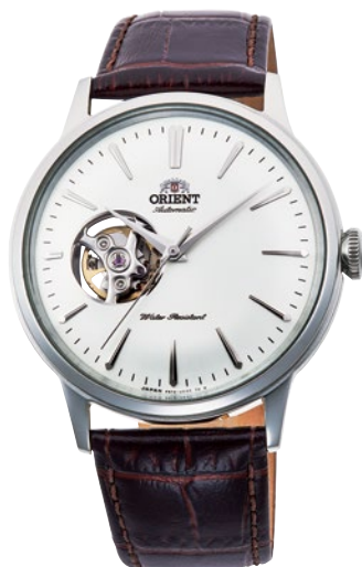
61 RN-AG0005S ¥36,300 (¥33,000+税)