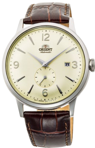
67 RN-AP0003S ¥35,200 (¥32,000+税)