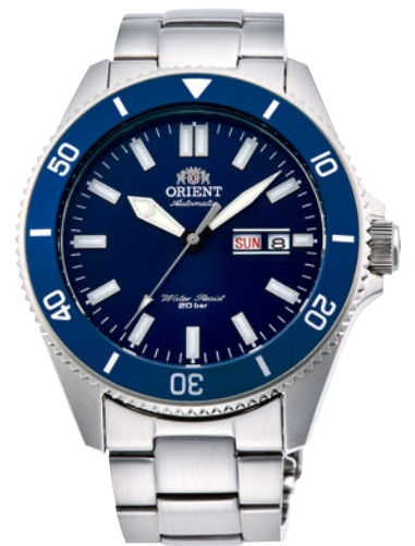
15 RN-AA0007L ¥37,400 (¥34,000+税)

[ 10～15 共通仕様 ] 自動巻き(手巻き付) / 駆動時間: 40 時間以上(最大巻き上げ時) / 秒針停止装置付 / 22 石 / ガラス: 無機ガラス/ルミノライト/耐磁 1 種 日常生活用強化防水 (20 気圧) / ねじ式りゅうず/回転ベゼル(逆回転防止構造) / ケース: ステンレススチール/バンド: ステンレススチール (SUS316L) プッシュ W ロック三つ折式中留 (10～12・14・15) / バンド: シリコン (13) / ケースサイズ: H50.0 × W43.6 × T12.9 mm / バンド幅: 22mm 精度: 日差+25 秒～-15 秒 (Made in Japan)