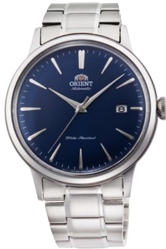
65 RN-AC0003L ¥35,200 (¥32,000+税)