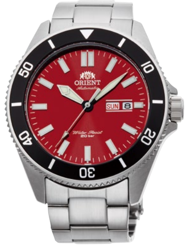
12 RN-AA0915R ¥37,400 (¥34,000+税)