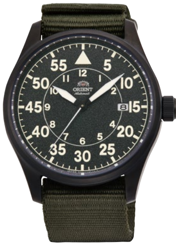
26 RN-AC0H02N ¥31,900 (¥29,000+税)