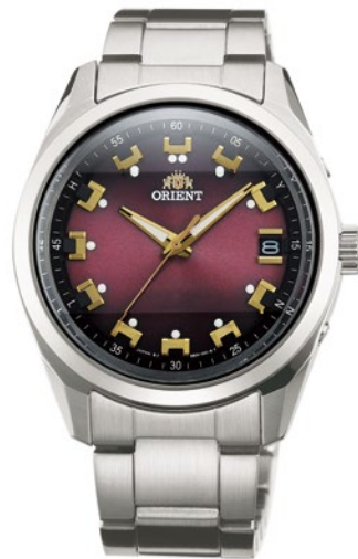
116 WV0081SE ¥39,600 (¥36,000+税)