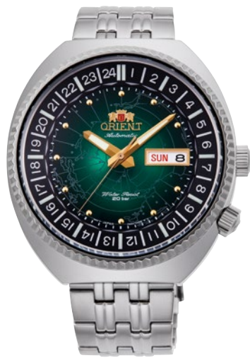
46 RN-AA0E02E ¥49,500 (¥45,000+税)

[ 44 ~ 46 共通仕様 ] 自動巻き (手巻き付) / 駆動時間 : 40 時間以上 (最大巻き上げ時) / 秒針停止装置付 / 22 石 / 内装回転リング / ガラス : 球面無機ガラス 耐磁 1 種 / 日常生活用強化防水 (20 気圧) / ケース : ステンレススチール / バンド : ステンレススチール (SUS316L) / ケースカラー : ゴールド色めっき (45 ※6 ) プッシュ三つ折式中留 / ケースサイズ : H46.0 × W43.5 × T13.9 mm / バンド幅 : 20mm / 精度 : 日差 + 25 秒 ~ - 15 秒 (Made in Japan)