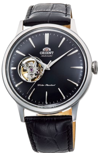
62 RN-AG0007B ¥36,300 (¥33,000+税)