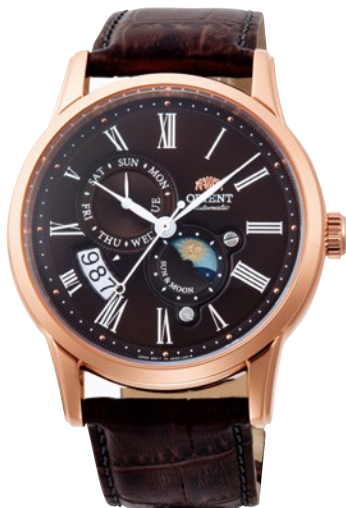
51 RN-AK0002Y ¥57,200 (¥52,000+税)