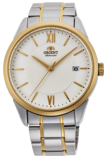
118 RN-AC0013S ¥38,500 (¥35,000+税)