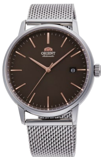
100 RN-AC0E05N ¥30,800 (¥28,000+税)