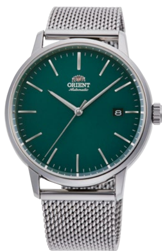
101 RN-AC0E06E ¥30,800 (¥28,000+税)

[ 100・101 共通仕様 ] 自動巻き (手巻き付) / 駆動時間: 40 時間以上 (最大巻き上げ時) / 秒針停止装置付 / 22 石 / 無機ガラス / シースルーバック / 耐磁 1 種 日常生活用強化防水 (10 気圧) / ケース: ステンレススチール / バンド: ステンレススチール (SUS316L) / スライダー (中留) ケースサイズ: H46.1 × W40.0 × T11.9 mm / バンド幅: 20mm / 精度: 日差+ 25 秒〜- 15 秒 (Made in Japan)