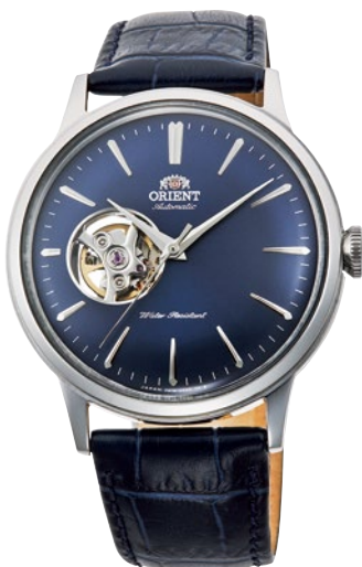
63 RN-AG0008L ¥36,300 (¥33,000+税)

[ 60 ~ 63 共通仕様 ] 自動巻き (手巻き付) / 駆動時間 : 40 時間以上 (最大巻き上げ時) / 秒針停止装置付 / 22 石 / ボックス無機ガラス / シースルーバック 耐磁 1 種 / 日常生活用防水 (3 気圧) / ケース : ステンレススチール / ケースカラー : ピンクゴールド色めっき (60) / バンド : 皮革 ケースサイズ : H45.5 × W40.5 × T12.0 mm / バンド幅 : 21mm / 精度 : 日差 + 25 秒 ~ - 15 秒 (Made in Japan)