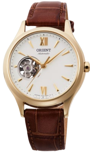
70 RN-AG0728S ¥34,100 (¥31,000+税)