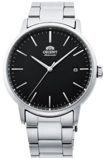
96 RN-AC0E01B ¥30,800 (¥28,000+税)