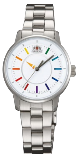
127 WV0011NB ¥25,300 (¥23,000+税)