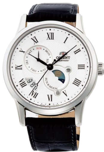
53 RN-AK0005S ¥55,000 (¥50,000+税)

[ 50 ~ 53 共通仕様 ] 自動巻き(手巻き付) / 駆動時間: 40 時間以上(最大巻き上げ時) / 秒針停止装置付 / 22 石 / SUN&MOON 表示 / 球面サファイアクリスタル シースルーバック / 耐磁 1 種 / 日常生活用強化防水 (5 気圧) / ケース: ステンレススチール / ケースカラー: ピンクゴールド色めっき (50・51) / バンド: 皮革 プッシュ三つ折式中留 / ケースサイズ: H50.5 × W42.5 × T14.0 mm / バンド幅: 22mm / 精度: 日差 + 25 秒 ~ - 15 秒 (Made in Japan)