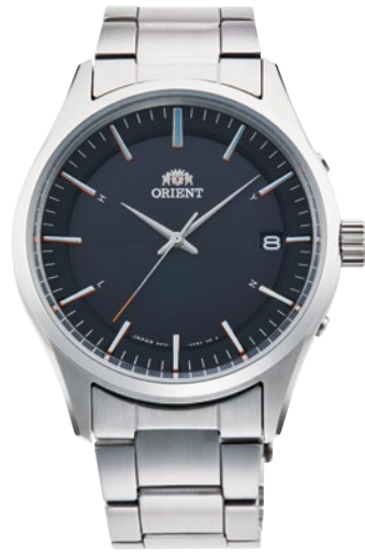
110 RN-SE0002B ¥39,600 (¥36,000+税)