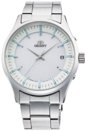
109 RN-SE0001S ¥39,600 (¥36,000+税)