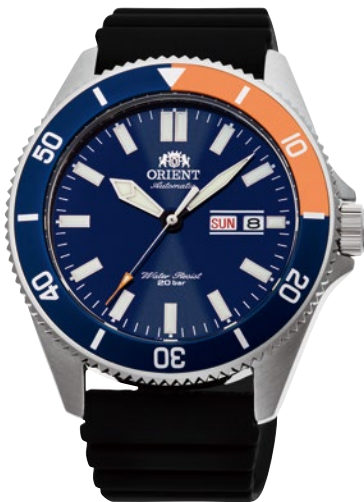
13 RN-AA0916L ¥35,200 (¥32,000+税)