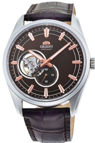
82 RN-AR0004Y ¥44,000 (¥40,000+税)

[ 79 ~ 82 共通仕様 ] 自動巻き (手巻き付) / 駆動時間 : 40 時間以上 (最大巻き上げ時) / 秒針停止装置付 / 24 石 / サファイアクリスタル / シースルーバック ルミナスライト / 耐磁 1 種 / 日常生活用強化防水 (5 気圧) / ケース : ステンレススチール / バンド : ステンレススチール (SUS316L) (79・80) ・皮革 (81・82) プッシュ三つ折式中留 (79・80) / ケースサイズ : H48.0 × W40.8 × T10.9 mm / バンド幅 : 22mm / 精度 : 日差 + 25 秒 ~ - 15 秒 (Made in Japan)