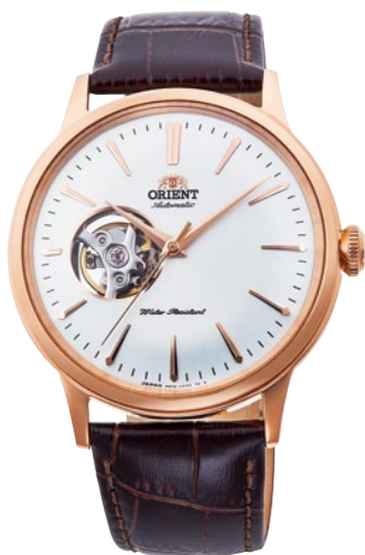
60 RN-AG0004S ¥38,500 (¥35,000+税)