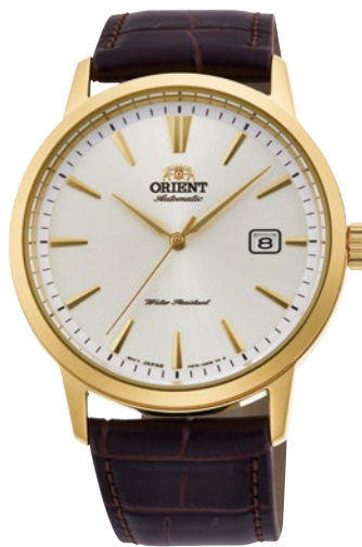
123 RN-AC0F04S ¥28,600 (¥26,000+税)