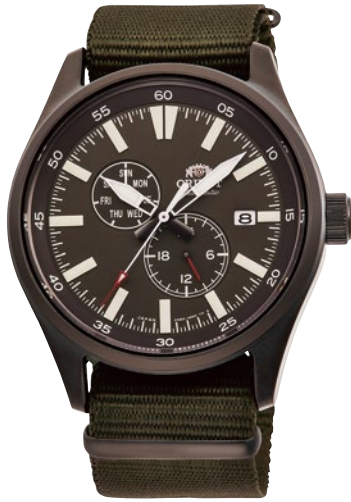
24 RN-AK0403N ¥35,200 (¥32,000+税)