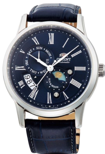
52 RN-AK0004L ¥55,000 (¥50,000+税)