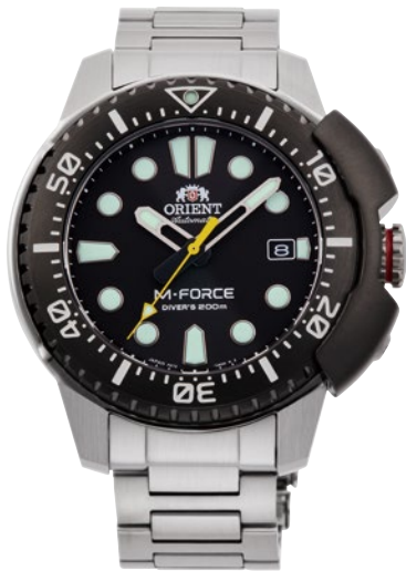
03 RN-AC0L01B ¥71,500 (¥65,000+税)