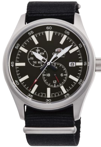
25 RN-AK0404B ¥33,000 (¥30,000+税)