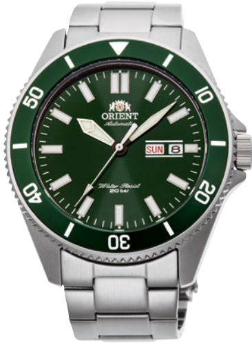
11 RN-AA0914E ¥37,400 (¥34,000+税)