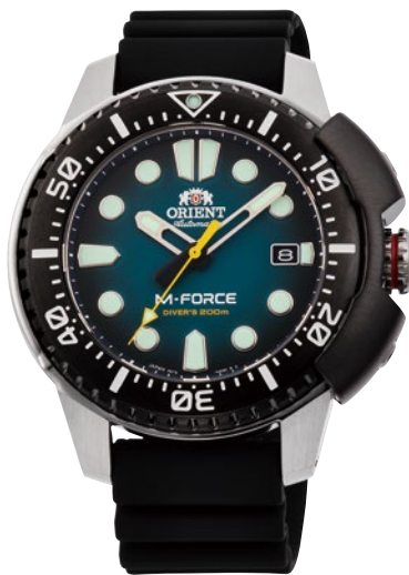
06 RN-AC0L04L ¥66,000 (¥60,000+税)

[ 03～06 共通仕様 ] 自動巻き(手巻き付) / 駆動時間: 40 時間以上(最大巻き上げ時) / 秒針停止装置付 / 22 石 / ガラス: サファイアクリスタル (AR コーティング) ルミナスライト / 耐磁 1 種 / 200m 空気潜水用防水 / ねじ式リュウズ / 回転ベゼル (逆回転防止構造) / ケース: ステンレススチール (SUS316L) / プロテクションシールド バンド: ステンレススチール (SUS316L) (03・04) ・シリコン (05・06) / プッシュWロック三つ折れ式中留 (03・04) / ケースカラー: 黒色めっき (05) ケースサイズ: H52.0 × W45.0 ※3 × T13.2 mm / バンド幅: 20mm / 精度: 日差+ 25 秒～- 15 秒 (Made in Japan)