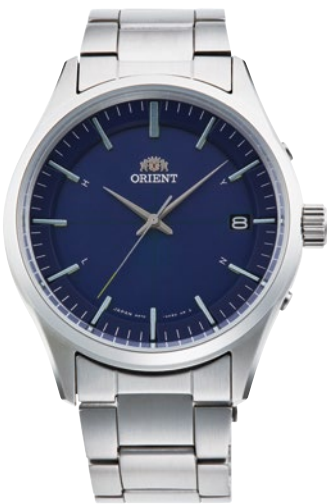
111 RN-SE0003L ¥39,600 (¥36,000+税)