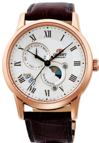
50 RN-AK0001S ¥57,200 (¥52,000+税)