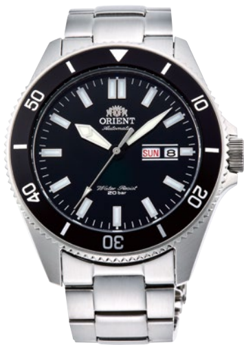
14 RN-AA0006B ¥37,400 (¥34,000+税)