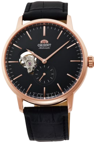
95 RN-AR0103B ¥39,600 (¥36,000+税)