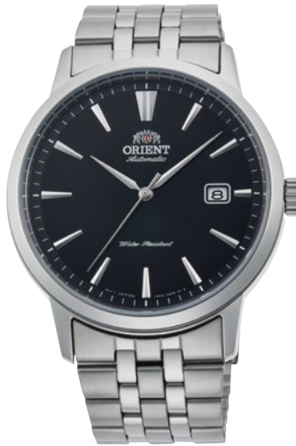
121 RN-AC0F01B ¥28,600 (¥26,000+税)