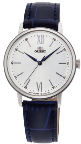
73 RN-QC1705S ¥18,700 (¥17,000+税)

[ 69・70 共通仕様 ] 自動巻き(手巻き付) / 駆動時間: 40 時間以上(最大巻き上げ時) / 秒針停止装置付 / 22 石 / 球面無機ガラス / シースルーバック 耐磁 1 種 / 日常生活用防水 (3 気圧) / ケース: ステンレススチール / ケースカラー: ピンクゴールド色めっき (69) ・ゴールド色めっき (70) バンド: 皮革 / ケースサイズ: H42.6 × W32.9 × T12.2 mm / バンド幅: 17mm / 精度: 日差 +25 秒 ~ -15 秒 <Made in Japan> [ 71 ~ 73 共通仕様 ] クォーツ / 電池寿命: 約 3 年 / 無機ガラス / 日常生活用強化防水 (5 気圧) / ケース: ステンレススチール バンド: ステンレススチール (SUS316L) / スライダー (中留) (71・72) ・皮革 (73) / ケースサイズ: H39.5 × W33.8 × T8.2 mm / バンド幅: 16mm 精度: 月差 ± 20 秒以内 <Made in Japan>