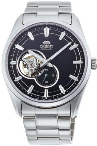
79 RN-AR0001B ¥46,200 (¥42,000+税)