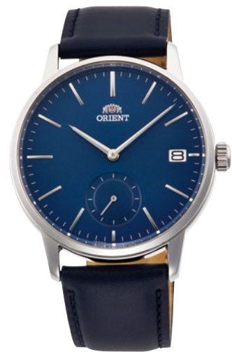
89 RN-SP0004L ¥18,700 (¥17,000+税)

[ 86・87 共通仕様 ] 自動巻き (手巻き付) / 駆動時間: 40 時間以上 (最大巻き上げ時) / 秒針停止装置付 / 24 石 (86)・22 石 (87) / 無機ガラス/シースルーバック 耐磁 1 種 / 日常生活用強化防水 (10 気圧) / ケース: ステンレススチール / バンド: ステンレススチール (SUS316L) (86)・皮革 (87) / プッシュ三つ折式中留 (86) ケースサイズ: H46.1 × W40.0 × T11.9 mm / バンド幅: 20mm / 精度: 日差 +25 秒 ~ -15 秒 (Made in Japan) [ 88・89 共通仕様 ] クォーツ / 電池寿命: 約 3 年 (88)・約 5 年 (89) / 無機ガラス / 日常生活用強化防水 (5 気圧) / ケース: ステンレススチール バンド: ステンレススチール (SUS316L) (88)・皮革 (89) / プッシュ三つ折式中留 (88) / ケースサイズ: H45.7 × W40.4 × T9.9 mm (88) ケースサイズ: H45.5 × W39.0 × T9.4 mm (89) / バンド幅: 20mm / 精度: 月差 ± 20 秒以内 1/1 秒ストップウオッチ (30 分計測) (88) (Made in Japan)