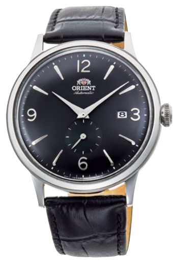
68 RN-AP0005B ¥35,200 (¥32,000+税)

[ 64 ~ 68 共通仕様 ] 自動巻き (手巻き付) / 駆動時間 : 40 時間以上 (最大巻き上げ時) / 秒針停止装置付 / 22 石 (64・65)・24 石 (66 ~ 68) / ボックス無機ガラス シールーバック / 耐磁 1 種 / 日常生活用防水 (3 気圧) / ケース : ステンレススチール / バンド : ステンレススチール (SUS316L) / プッシュ観音式中留 / バンド : 皮革 (66 ~ 68) ケースサイズ : H46.5 × W40.5 × T12.3 mm / バンド幅 : 21mm / 精度 : 日差 + 25 秒 ~ - 15 秒 (Made in Japan)