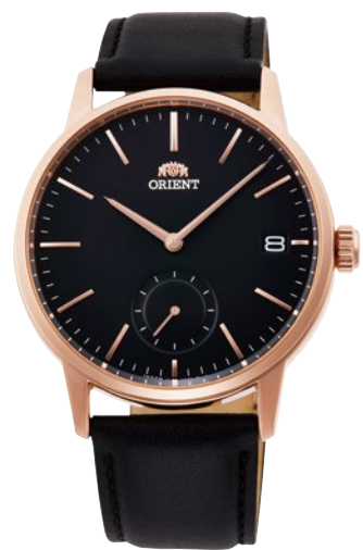
99 RN-SP0003B ¥20,900 (¥19,000+税)

[ 95・96 共通仕様 ] 自動巻き (手巻き付) / 駆動時間: 40 時間以上 (最大巻き上げ時) / 秒針停止装置付 / 24 石 (95)・22 石 (96) / 無機ガラス / シースルーバック耐磁 1 種 / 日常生活用強化防水 (10 気圧) / ケース: ステンレススチール / ケースカラー: ピンクゴールド色めっき (95) / バンド: ステンレススチール (SUS316L) (96)・皮革 (95) / プッシュ三つ折式中留 (96) / ケースサイズ: H46.1 × W40.0 × T11.9 mm / バンド幅: 20mm / 精度: 日差 + 25 秒 ~ - 15 秒 (Made in Japan) [ 97 ~ 99 共通仕様 ] クォーツ / 電池寿命: 約 3 年 (97)・約 5 年 (98・99) / 無機ガラス / 日常生活用強化防水 (5 気圧) / ケース: ステンレススチール / バンド: ステンレススチール (SUS316L) (98)・皮革 (97・99) / プッシュ三つ折式中留 (98) / ケースカラー: ピンクゴールド色めっき (99) / ケースサイズ: H45.7 × W40.4 × T9.9 mm (97) / ケースサイズ: H45.5 × W39.0 × T9.4 mm (98・99) / バンド幅: 20mm / 精度: 月差 ± 20 秒以内 / 1/1 秒ストップウォッチ (30 分計測) (97) (Made in Japan)