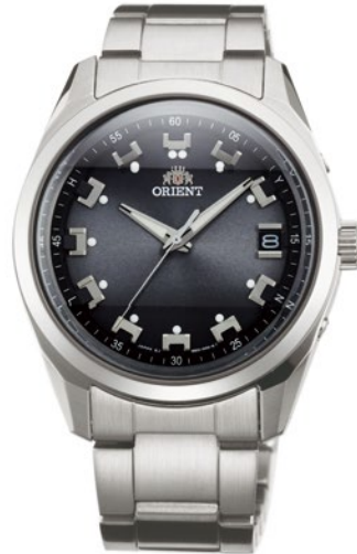
114 WV0061SE ¥39,600 (¥36,000+税)