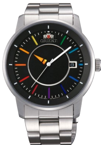
126 WV0761ER ¥25,300 (¥23,000+税)