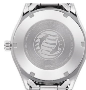
ケースバックの刻印