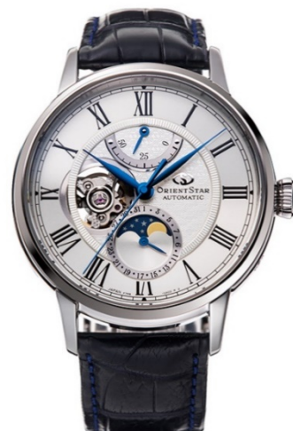
『メカニカルムーンフェイス』 「with ORIENT STAR」限定モデル RK-AY0112S

サイトでは、ブランドの歴史、開発者秘話、時計技術の豆知識、時計選びの解説、お客様との交流の場など、「ORIENT STAR」を長く楽しみ、ご愛用いただくための豊富なコンテンツを日々追加していく予定です。オープンに際しては、「with ORIENT STAR」に込めた想いを動画にしていますので、ぜひご覧ください。 https://orientstar-watch.com/pages/concept