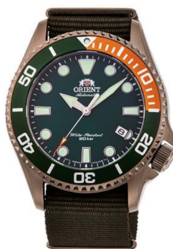
RN-AC0K04E 46,000 円+税