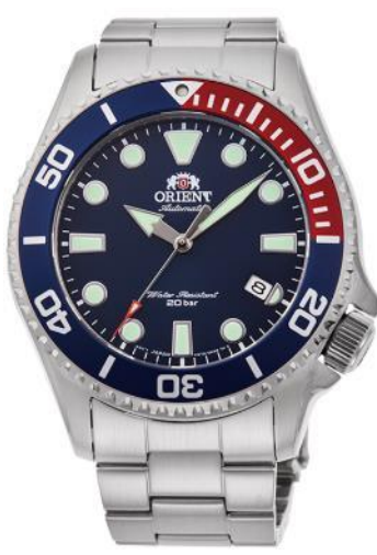
RN-AC0K03L 46,000 円+税